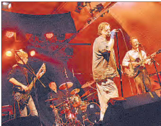
«Stiller Has»: In schweren Zeiten der Romantik die Stange halten.

Selbst die wasserscheuesten Landratten wissen: Frau an Bord bringt Seefahrern und Piraten bloss Unglück. Was Endo, der Pirat, selbstverständlich und zu Recht überhaupt nicht glaubt. Allerdings – bachab gegangen ist ihm der